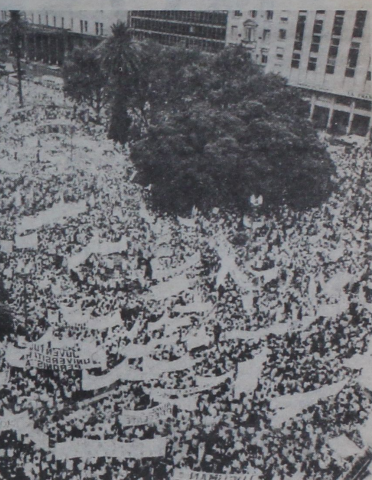
Marcha Blanca en Plaza de Mayo.